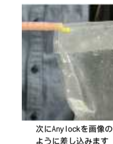
次にAnylockを画像のように差し込みます