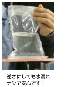
逆さにしても水漏れナシで安心です!