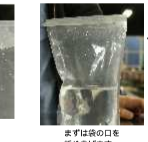
まずは袋の口を折り曲げます