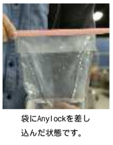
袋にAnylockを差し込んだ状態です。