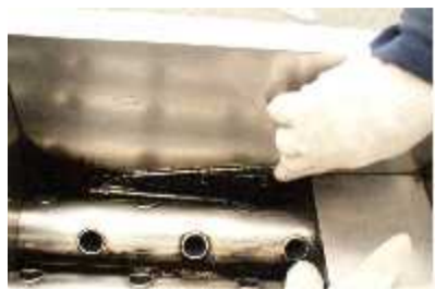
センサーの取り付け位置

写真で指をさしているところが、油の温度を感じている温度センサーの取り付け位置です。この温度センサーは、フライヤーで最も重要な部品で、油の温度を管理、調整しています。温度センサーは、槽内に取り付けてありますので、ご使用されているうちに油が付き着し、油の温度を感じにくくなり、故障の原因