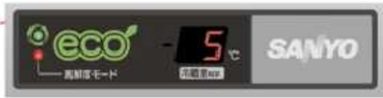
図2 ECOサインが点灯し お客様に省エネ運転をお知らせ!!

ラムは、コンプレッサの運転制御の他、外気温に応じた結露防止ヒーターの通電制御を行い、消費電力を抑えます。省エネ運転中は、本体上部のECOサイン(左図参照)が点灯し、お客様へ省エネ運転状況をお知らせします。