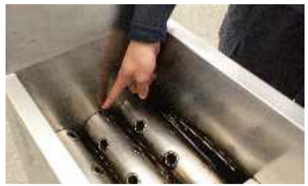
熱管パイプと槽の接合部

簡単にご覧いただける フライヤーのお手入れ方法 写真で指をさしているところが熱管パイプと槽の接合部で、この部分が焦げ付きやすく、清掃で見落としがちな部分だと思いがちです。こまめに清掃してください。清掃せずに焦げ付きのあるままご使用されますと、機器の劣化が促進され、槽割れによる火災の危険性があります。